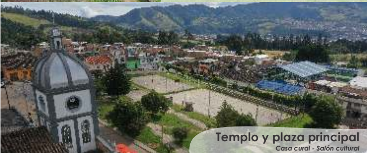
Templo y plaza principal Casa cural - Salón cultural