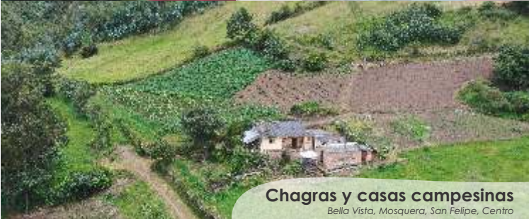
Chagras y casas campesinas Bella Vista, Mosquera, San Felipe, Centro