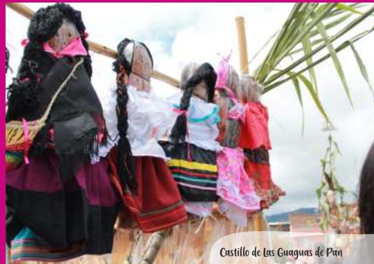
Castillo de las Guaguas de Pan