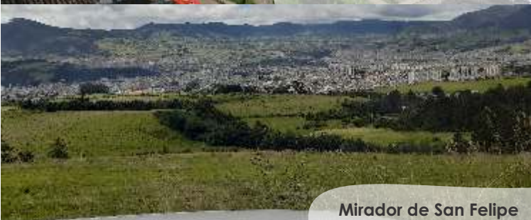
Mirador de San Felipe