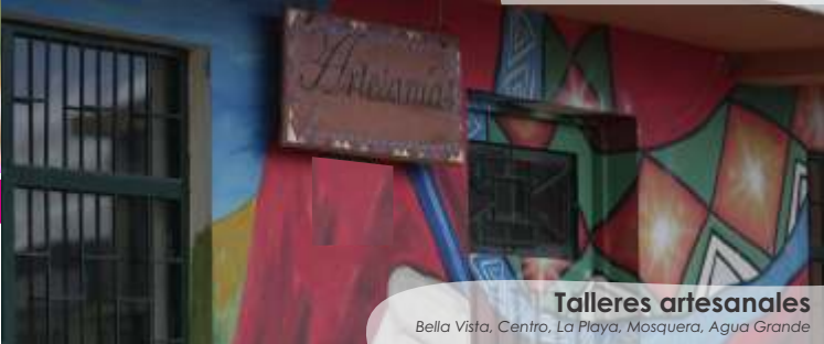
Talleres artesanales Bella Vista, Centro, La Playa, Mosquera, Agua Grande