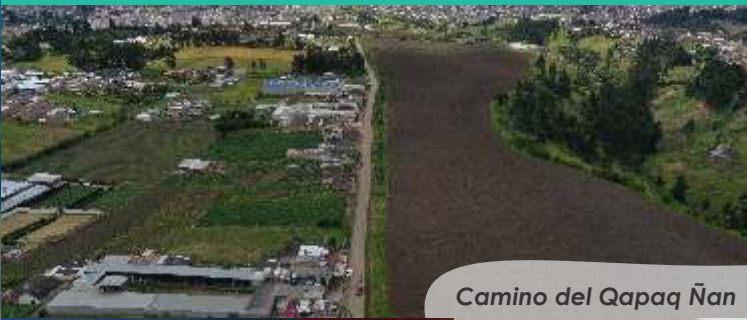
Camino del Qapaq Ñan